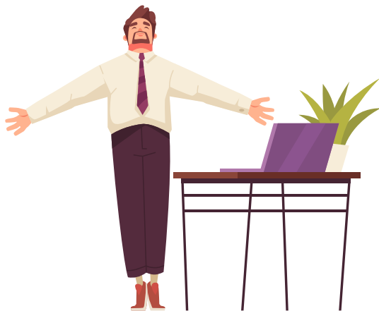
Der Code funktioniert