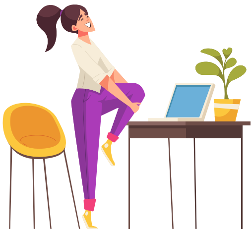
Aus Wut vor den Tisch getreten