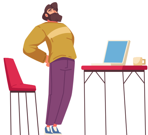
Die Mittagspause ruft