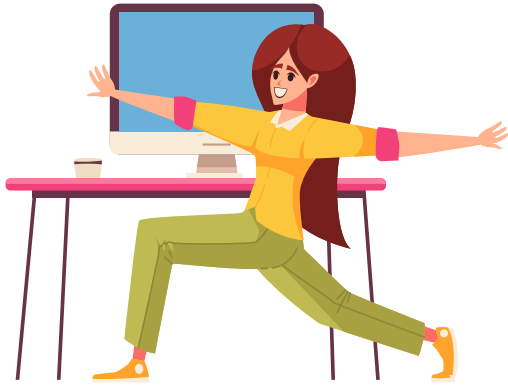
Mit großen Schritten an die Arbeit